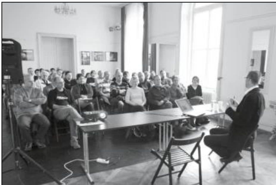
Dílna nápadů k novému územnímu plánu vyvolala zájem veřejnosti.