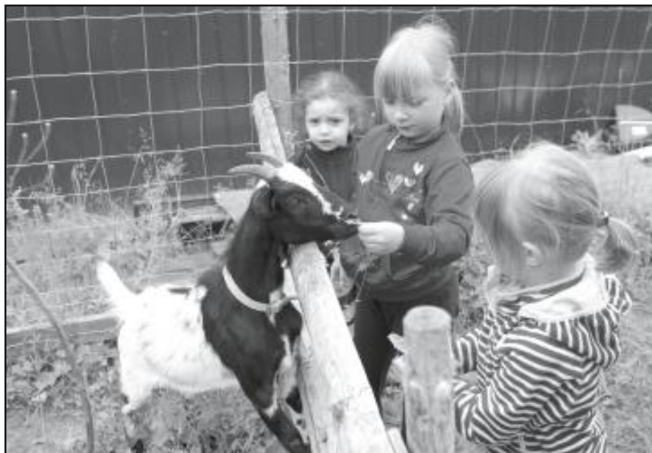
V souladu s přírodou.