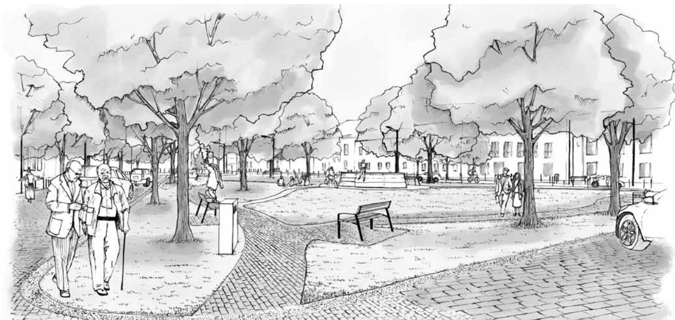
Pohled od Opletalovy ulice