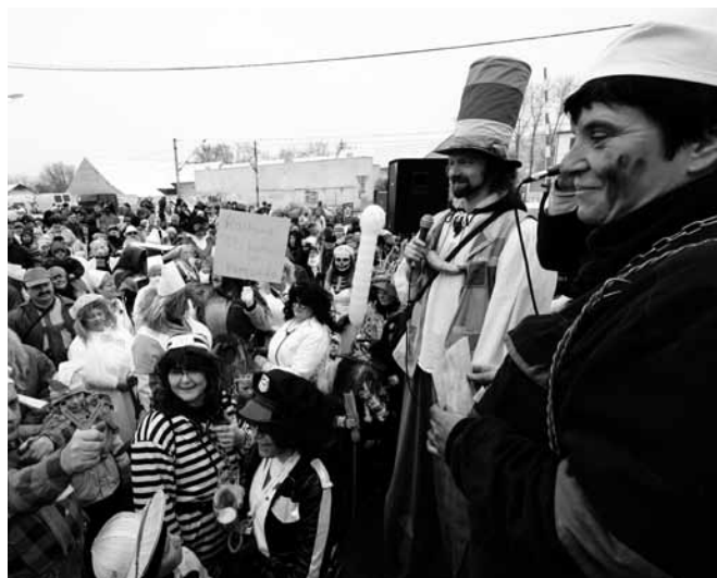
Masopust v Zadní Třebani