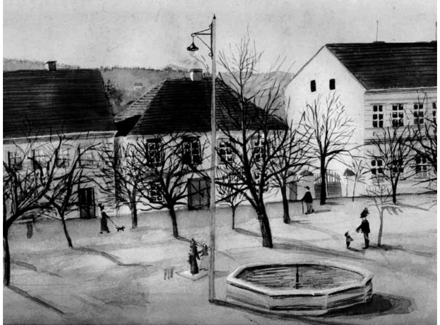
Původní budova radnice (uprostřed), zachycená na obraze Vladimíra Weisse. Budova byla zásadně rozšířena v roce 1921.