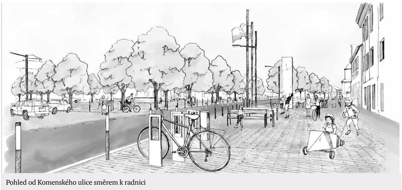
Pohled od Komenského ulice směrem k radnici