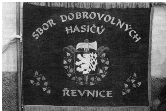
Hasičská vlajka vznikla u příležitosti oslav 100 let vzniku hasičského sboru v Řevnicích

Motto: Hasiči byli, jsou a budou. Občané by měli mít k nim úctu a jejich práce si vážit v každé době.