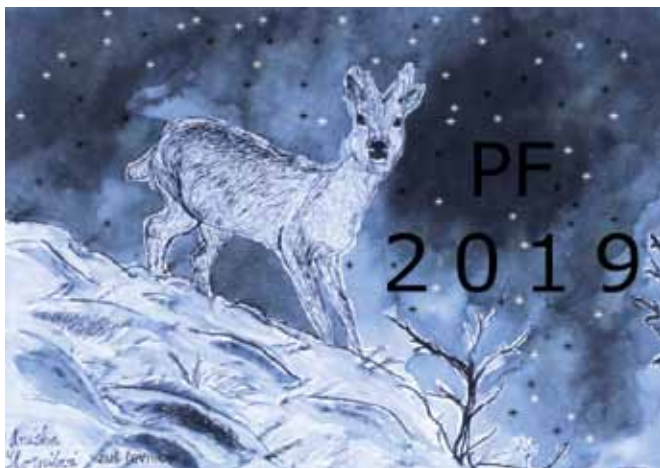
PF žáků řevnické ZUŠ (Anežka Škorpilová, Filip Hrdlička)

Na první pohled výrazné je i navýšení sumy v položce Bytové hospodářství. Zatímco v roce 2018 činily výdaje 3,7 milionu korun, pro rok 2019 jsou plánovány ve výši 10,7 milionu korun. Důvod? „Opět je v sumě započtena finanční spoluúčast. Jde o projekt zateplení a výměny oken radnice a zateplení objektu bývalé školy v čp. 27, kde současně vzniknou dva nové podkrovní byty,“ vysvětlil Smrčka. ■