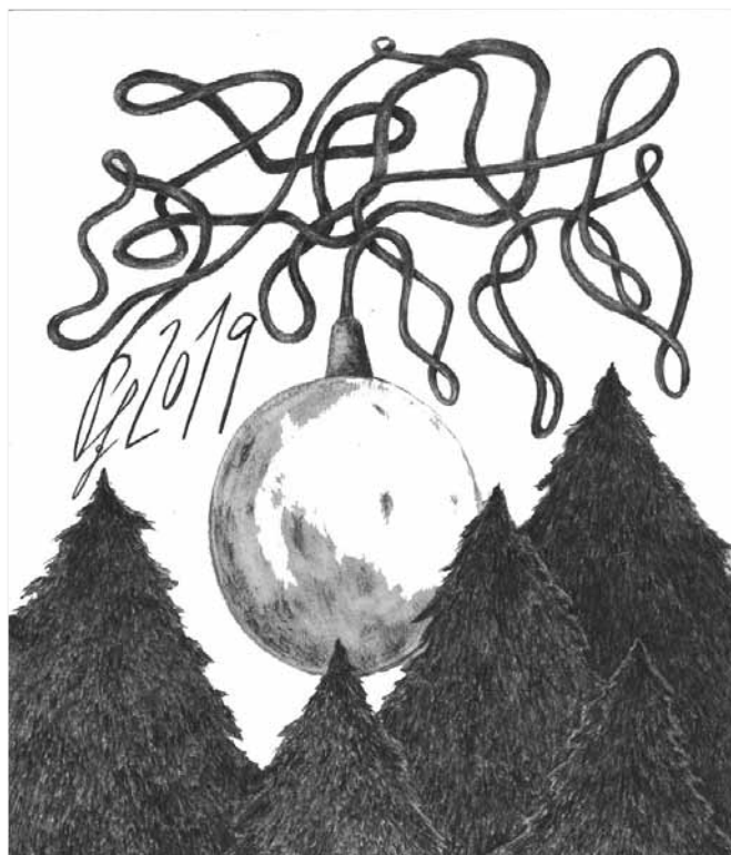
PF Anežky Jirasové, žákyně řevnické ZUŠ